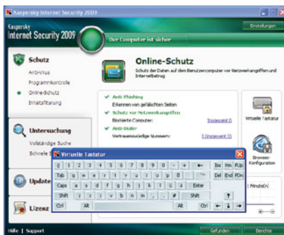
Kaspersky Internet Security 2009. Virtuelle Tastatur