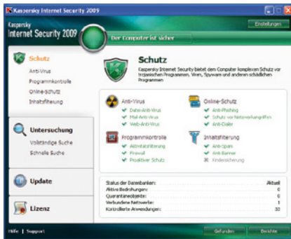
Kaspersky Internet Security 2009. Übersicht

Die neue Benutzeroberfläche von Kaspersky Internet Security 2009 informiert klar und schnell über den Schutzstatus und sämtliche Aktionen, die auf dem PC vorgenommen werden.