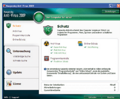
Kaspersky Anti-Virus 2009. Übersicht

Die neue Benutzeroberfläche von Kaspersky Anti-Virus 2009 informiert klar und schnell über den Schutzstatus und sämtliche Aktionen, die auf dem PC vorgenommen werden.